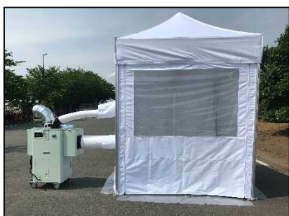
冷却テント+吊りテントあり、 使用イメージ