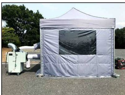
冷却テント+吊りテントあり、 使用イメージ