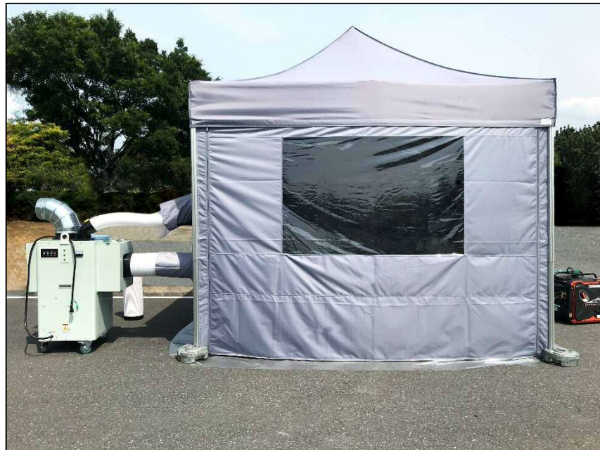
「冷える～む2」冷却テント 3(L)m×3(W)m×3(H)m

総合建設機械レンタル業の株式会社アクティオ(本社:東京都中央区日本橋、代表取締役社長兼 COO:小沼直人、以下アクティオ)は、屋内、屋外問わず簡単に設置ができる循環型1.5馬力移動式クーラー(以下1.5馬力クーラー)と簡易組立可能な冷却テント(以下:簡易テント)を組み合わせた休憩所「冷える～む2」を2020年6月中旬からレンタル開始いたします。