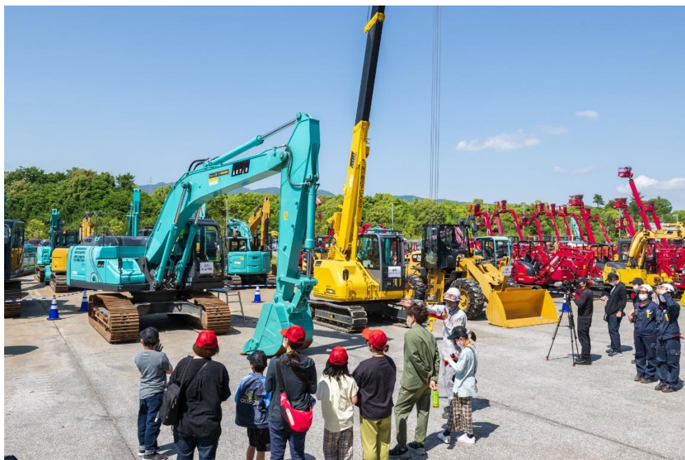
大型建設機械の見学風景

今回の体験学習では、「大型建設機械」と「地球環境に優しいアクティオの施策」を通し、いなべ市の子どもたちに有意義な学習機会となるよう、SDGs 体験型ワークショップを実施させていただきました。