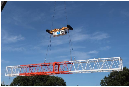
【様々な形の吊り荷を吊ることが可能】