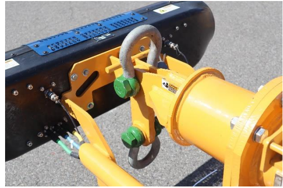
【吊り環は左右に2箇所】