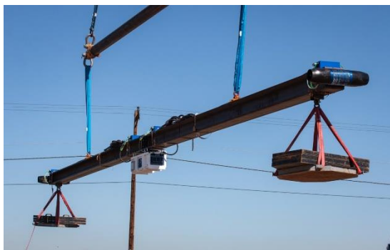
【ファンを機体から取り外し、位置を広げることで、吊り荷回転・停止の能力を向上】