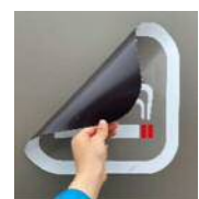
マグネット式サインボード

・中小企業事業主が屋外喫煙所の設置をした場合に受けられる「受動喫煙防止対策助成金」を受けられる給換気システムを採用(レンタル契約での設置は助成対象外)