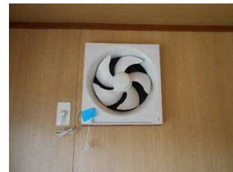
分煙用大型電動換気