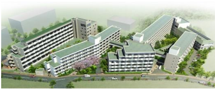
浜名湖エデンの園 全体鳥瞰図

浜名湖エデンの園は、1973年（昭和48年）に1号館を開設し、1976年（昭和51年）に2号館を設置。その後、現在6号館まで増築や耐震対策を行ってきましたが、さらなる入居者の安全・安心の確保のため、この度の建替えに至りました。