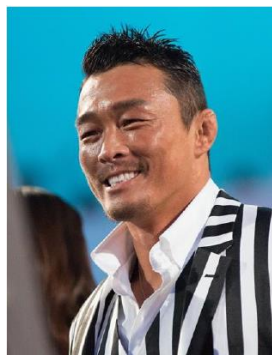
発起人 格闘家・秋山 成勲