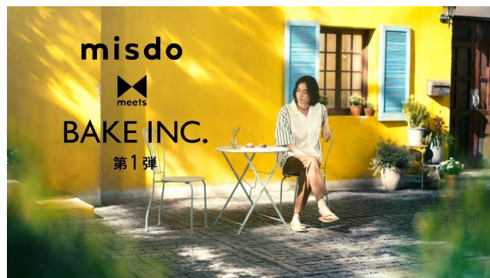
<ミスタードーナツ新 TVCM「チョコとチーズがタルってる（リンゴ）」篇より>