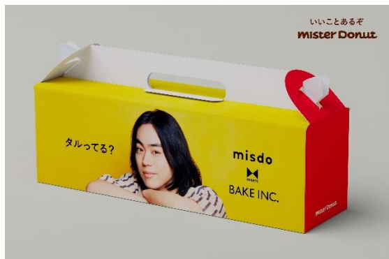
※写真はイメージ（ダースボックス）です。

※ダースボックス（10～12個用）とハーフボックス（5～9個用）の2種類ありますが、デザインは共通です。表面と裏面でデザインが異なります。