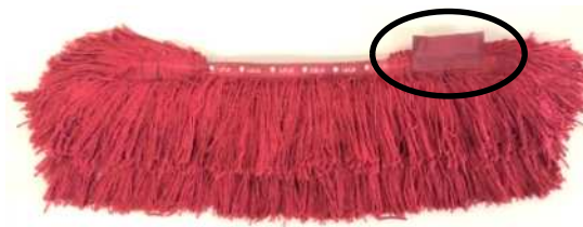
RFIDタグを取り付けたレンタルマット(左)・モップ(右)