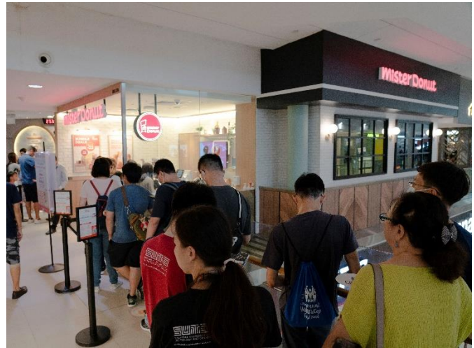
シンガポール 第 1 号店 ミスタードーナツ Junction8 ショップ（写真左） と待機列の様子（写真右）