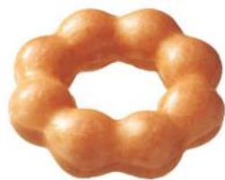
人気 No.1 ポン・デ・リング