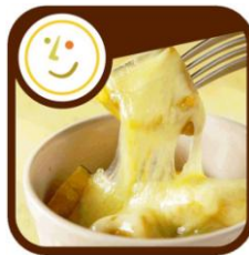
「オーダーチーズのとろ～りチーズがおいしいレシピ powered by Clip dish」アイコン

株式会社ザッパラス（本社：東京都渋谷区、代表取締役会長兼社長：玉置真理）は、10 月 1 日（月）より提供を開始したレシピ管理サイト「Clip dish」の姉妹サービスとして展開している、「Clip dish」アプリシリーズの第 2 弾として、この度、ボジョレー・ヌーボーの解禁に合わせ、「オーダーチーズのとろ～りチーズがおいしいレシピ powered by Clip dish～世界のチーズ専門店が教える、簡単でおしゃれなチーズ料理」の提供を開始いたします。