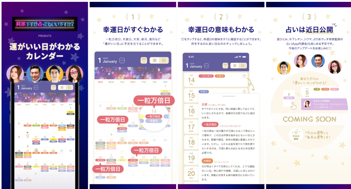
アプリ画面イメージ