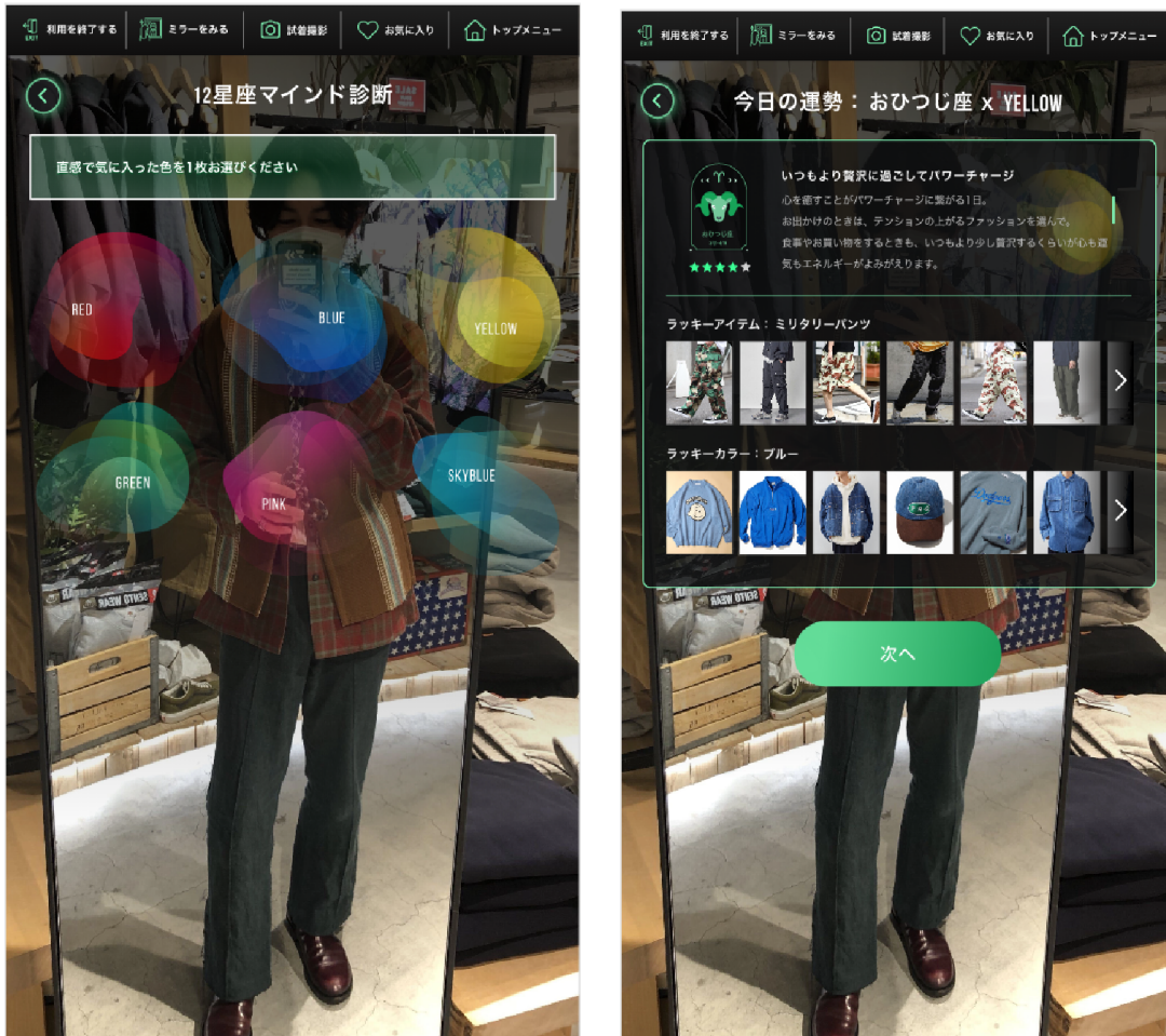
※「12星座マインド診断」での診断イメージ

「12星座マインド診断」では、お客様の星座と直感的に選ばれたモチーフを掛け合わせた診断結果から、今日の運勢やラッキーアイテム・ラッキーカラーの提案をおこない、いつものお買い物とは違った体験をお楽しみいただけます。