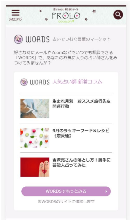
【cocoloni PROLOでの掲載イメージ】

作成したコラムは、月間150万人以上に閲覧されている（GoogleアナリティクスのUU数を参考）cocoloni運営の大型占いメディア「cocoloni PROLO」のサイト内にも掲載されるチャンスがあります。掲載するコラムは、『WORDS』の運営側で選定させていただきます。※「cocoloni PROLO」での掲載はスマートフォンのみ