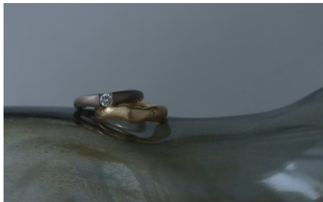
手作業の趣を残したデザインが人気