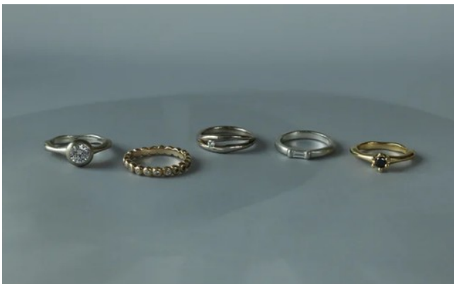
婚約指輪には新作もラインナップ