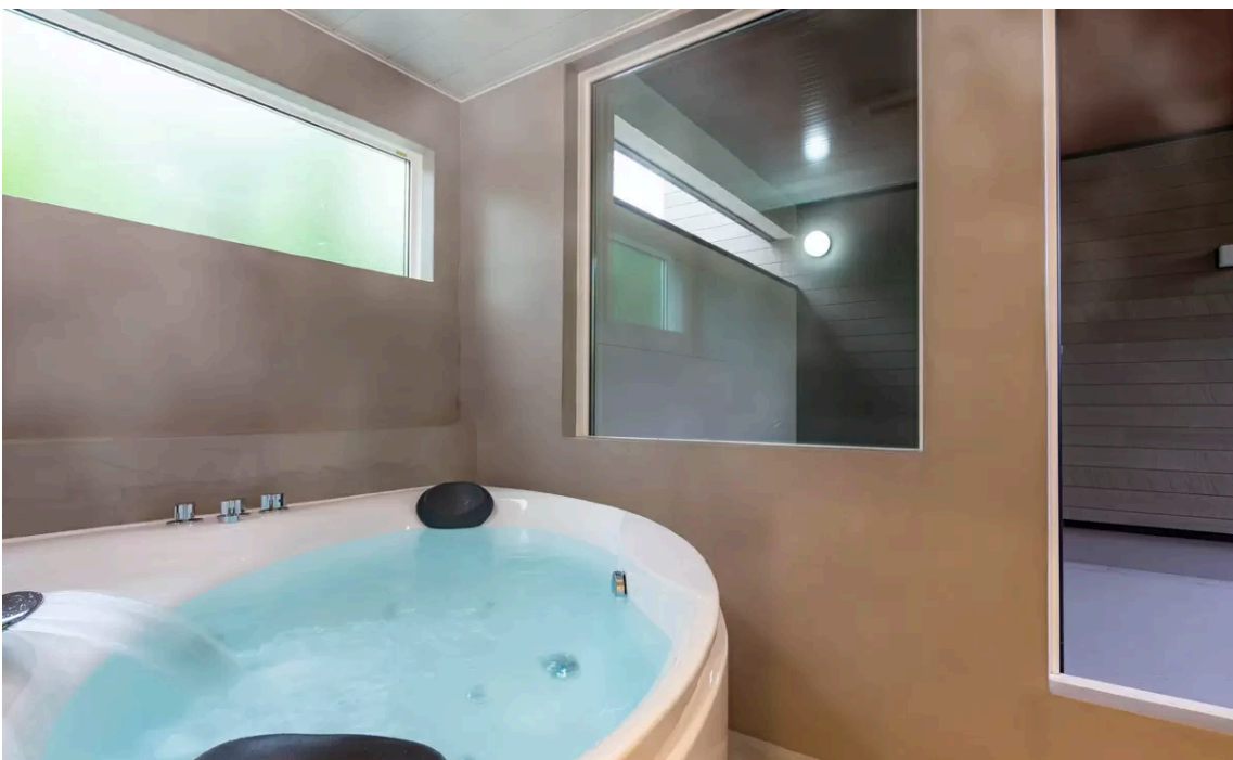
▽岩盤浴室と繋がる浴室