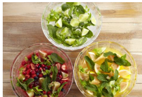
フレッシュ・モヒートパンチ