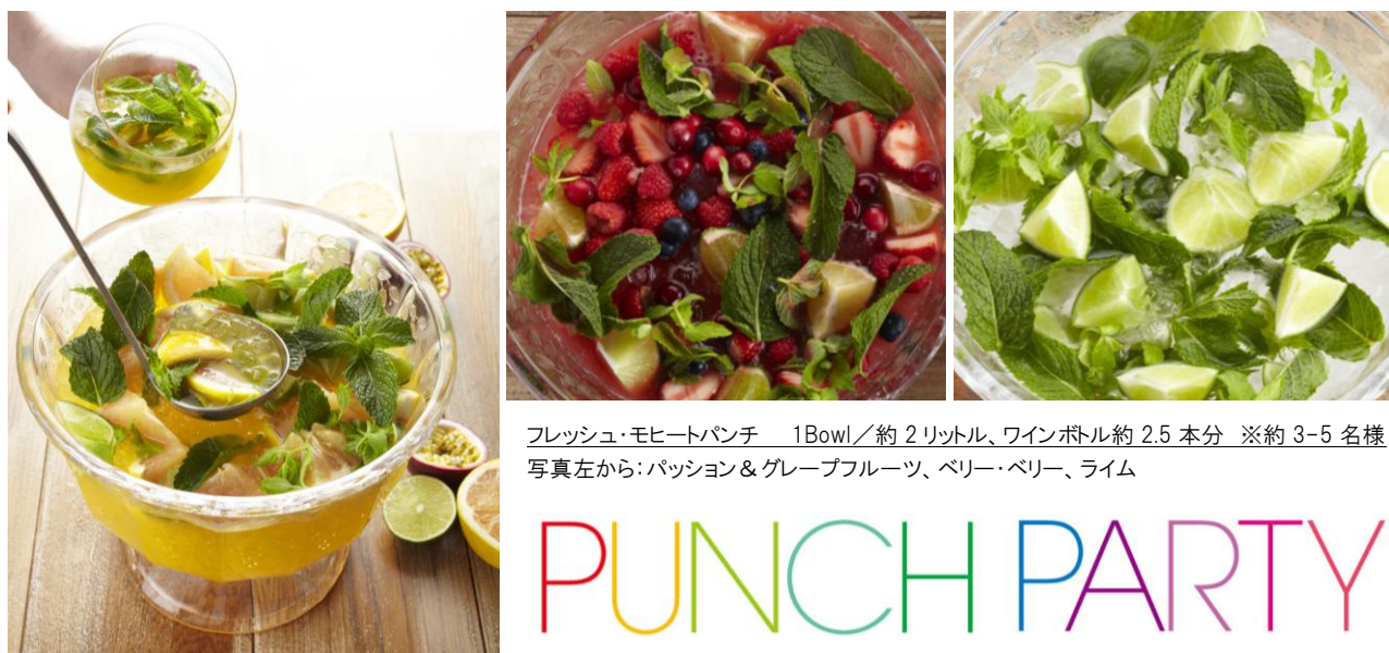
フレッシュ・モヒートパンチ 1 Bowl / 約 2 リットル、ワインボトル約 2.5 本分 ※約 3-5 名様 写真左から: パッション & グレープフルーツ、ベリー・ベリー、ライム

株式会社サザビーリーグ(本社:東京都渋谷区、代表取締役社長:森正督)が運営するカリフォルニア・ダイナー『EAT(イーエーティー)渋谷ヒカリエ』では、フレッシュフルーツとハーブをたっぷり使ったカクテル「Punch Bowl(パンチ・ボウル)」*の夏季限定メニューとして、「フレッシュ・モヒートパンチ」を6月25日(火)から発売します。