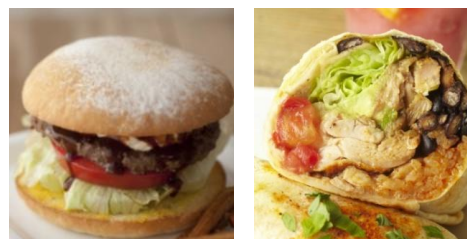
写真左から：EAT バーガー、EAT ブリートチキン