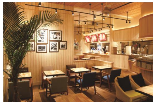
『EAT 渋谷ヒカリエ』 店内

【店舗名】 EAT 渋谷ヒカリエ 【所在地】 東京都渋谷区渋谷 2-21-1 渋谷ヒカリエ 7 階(TABLE 7) 【TEL】 03-6419-7496 【店舗面積・座席数】 46 坪 60 席 【営業時間】 11:00 ~ 23:00 11:00 ~ 28:00 (金・土・祝前日) <LAST ORDER> LUNCH 17:00 DINNER FOOD 22:00/DRINK 22:30 FOOD 27:00/DRINK 27:30(金・土・祝前日) 【定休日】 渋谷ヒカリエに準ずる 【URL】 http://eatburger.jp