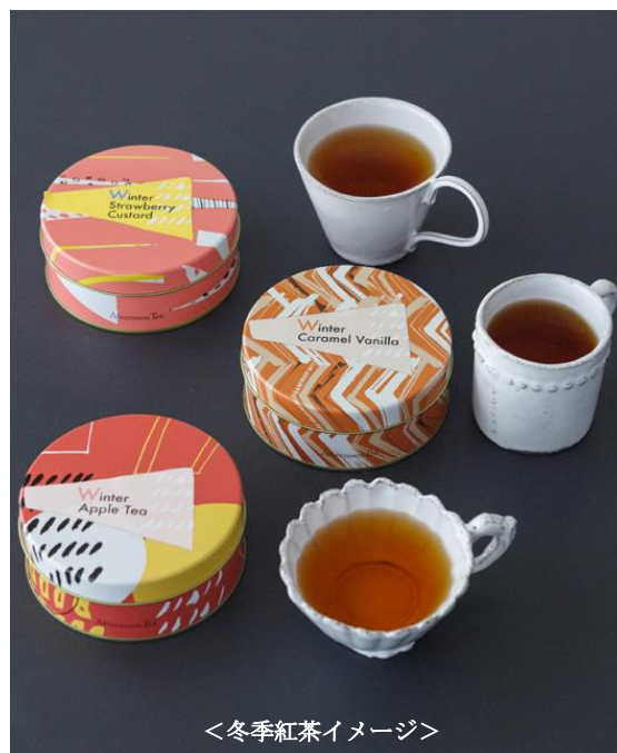
<冬季紅茶イメージ>

今回のバレンタインは、“You make me happy!” をテーマに、ビビッドで華やかなパッケージに詰め合わせた個性溢れるチョコレートをご用意しました。2種類の薄い板チョコにサクサクのクラッシュを散りばめた、上品な食感が魅力の「ダブルチョコクラッシュ」や、口の中でゆったりと溶け出すソフトな食感のキューブ型のチョコレート「キューブドショコラ」など、どんな方にも好まれる味わいのチョコレートをはじめ、ナッツとドライフルーツをチョコレートでコーティングした大人のためのデザートチョコレート「プチデセール」など、紅茶によく合う逸品を取り揃えています。