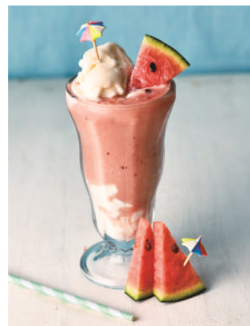
「スムージーファウンテン スイカベリー」 税込 788 円