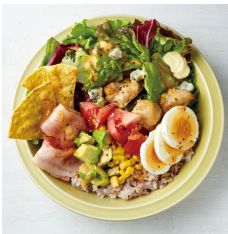
「サラダライス ニューヨークコブ」スープ付き 税込 1,058 円