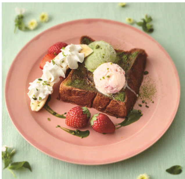
「ベーカースフレンチトースト イチゴミルクと抹茶プリュレ」税込 1,274 円 静岡お茶の老舗“雅正庵”の抹茶を使ったプリュレクリームをこだわりのプリオ ツシュに塗って焼き上げた“ふわとろ”食感のフレンチトースト。静岡県産いち ごのミルクアイスとも相性ぴったりの美味しさです（静岡パルシェ限定）

静岡パルシェだけのベーカースフレンチトーストが登場！ POP な見た目のスムージーファウンテンなど、“可愛い”ティータイムを提案します