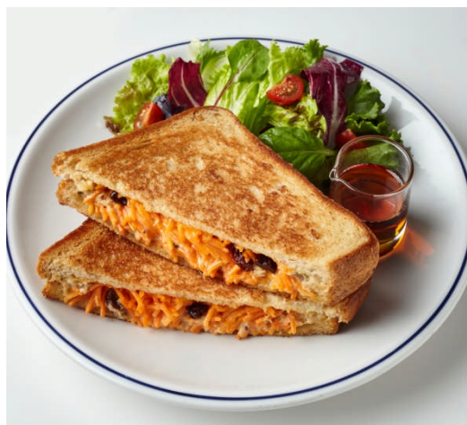
「パンフライドサンドイッチ ツナメルト」 税込 993 円（静岡パルシェ限定）