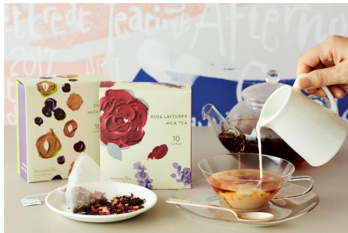
ミルクティーにおすすめ2種