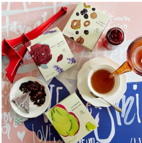
秋限定 TEA 3種