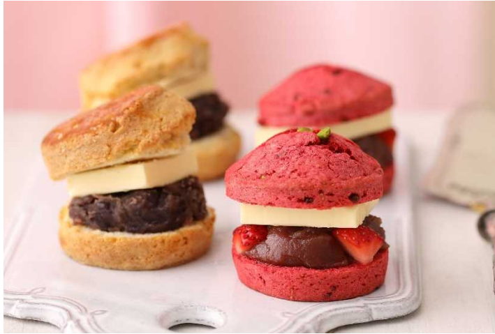
左：定番人気「あんバタースコーンサンド」 右：阪急パンフェア限定「苺づくしのあんバタースコーンサンド」