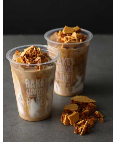
アイスダルゴナミルクティー