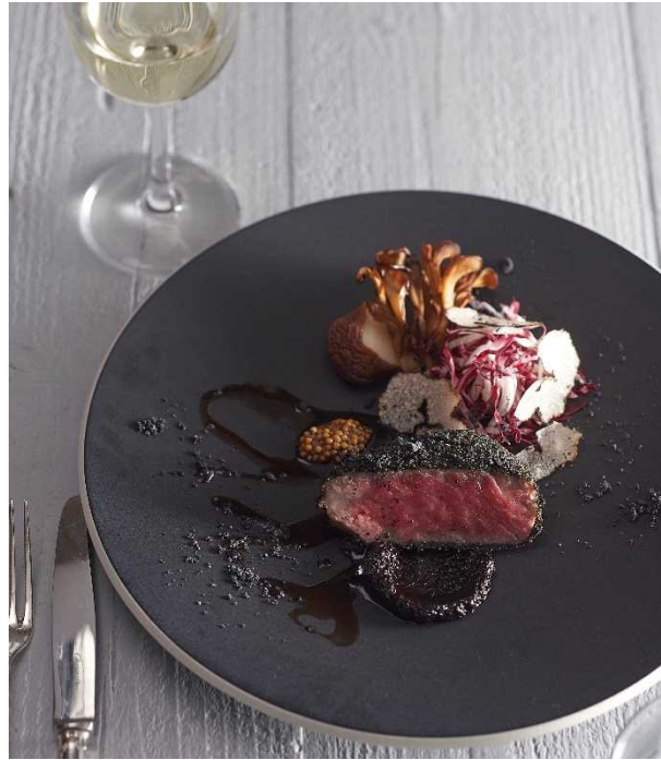
【オセアニア大陸】 オーストラリア産牛フィレ肉のブラックカツレツ 黒にんにくバルサミコソース サマートリュフを散りばめて