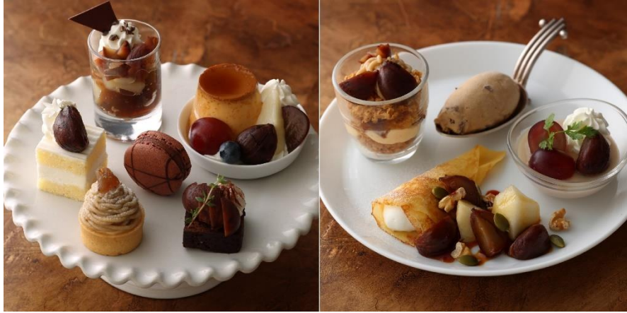
スイーツ 10 種 (1 段目・2 段目)