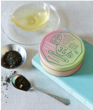
35 th 限定スペシャルティー 第 1 弾 さくら緑茶

●35 th 限定デザインマグカップ 1,296 円(税込) プレート 1,512 円(税込) 発売日:2 月 1 日(月)