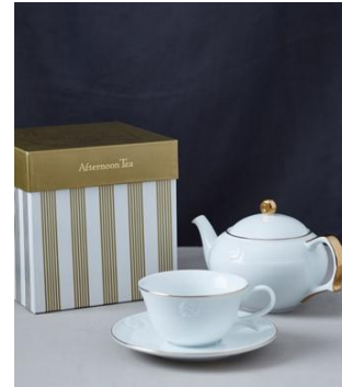
AT パラレルゴールドセット