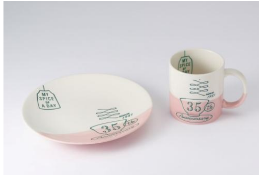
35 th 限定デザイン プレート/マグカップ