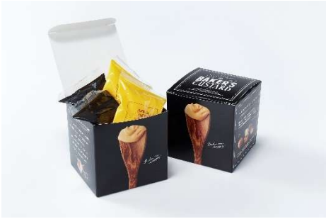
ベーカーズカスタード 4 個入