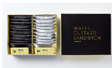
左上：ワッフルカスタードサンド 4 個入 左下：ワッフルカスタードサンド 8 個入