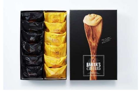
ベーカーズカスタード 12 個入