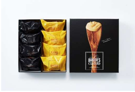
ベーカーズカスタード 8 個入