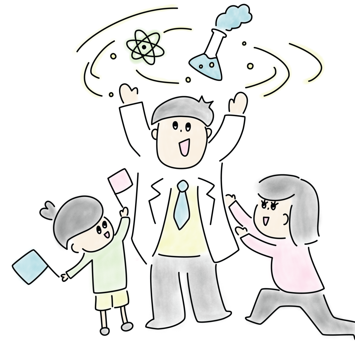
Illustration: Sara Kobayashi

Cheiron Grant Initiative for Families enabling Tomorrow's Science