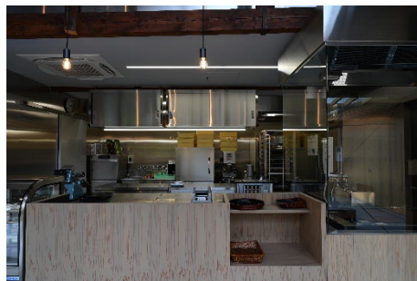
菓子工房でつくる抹茶スイーツやほう じ茶スイーツはテイクアウト可能