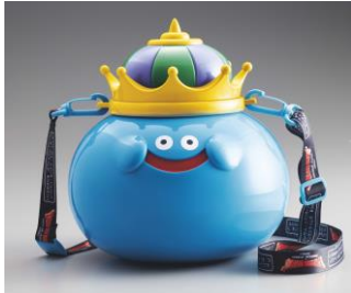
キングスライム・ポップコーンバケツ

ヒヤド(氷の呪文)で凍ってしまった!?スライムのソフローズン『スライム・ソフローズン〜ヒヤドで凍った!?ソーダ味〜』も販売いたします。アトラクションだけでなくフードでも「ドラゴンクエスト」の世界をご堪能ください。