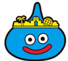
ユニバーサル・スタジオ・ジャパン オリジナル スライム