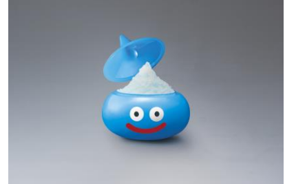
スライム・ソフローズン〜ヒヤドで凍った!?ソーダ味〜 ※4/20～販売予定