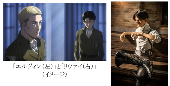
「エルヴィン(左)」と「リヴァイ(右)」 (イメージ)