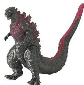
ゴジラ パーク限定フィギュア

完全パークオリジナルフィギュア。 アトラクションにも登場したキングギドラが、 スタイリッシュに目の前に出現！