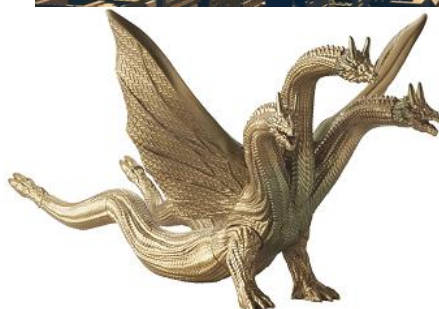
キングギドラ パーク限定フィギュア

完全パークオリジナルフィギュア。 アトラクションにも登場したキングギドラが、 スタイリッシュに目の前に出現！