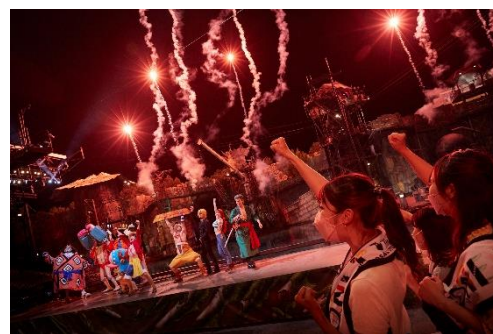
『ワンピース・プレミアショー2022』

7月1日(金)からは『ワンピース・プレミアサマー 2022』も開幕。今年は「ワンピース」連載25周年に加え、『ワンピース・プレミアショー』が初開催から15周年という2つの節目が重なる記念すべき特別な夏として、劇場版最新作「ONE PIECE FILM RED」(2022年8月6日(土)公開予定)と完全連動した、超興奮、超感動の体験をお届けします。また、「ルフィ」をはじめとした“麦わらの一味”が語るストーリーを聞きながら、爽快感たっぷりの空の冒険をスリルいっぱい体験できる作品史上初のジェットコースター『ワンピース×ハリウッド・ドリーム・ザ・ライド ～出航！ ミニメリー2号～』が初登場。「ルフィ」たちの元気な声に聴覚が支配され、そのストーリーとライドコースのアップ&ダウンがマッチし、まるで作品世界の中に飛び込んだような感覚をお楽しみいただけます。