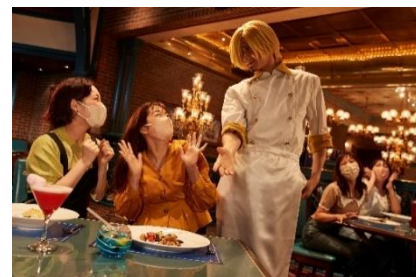
『サンジの海賊レストラン』

『ワンピース・プレミア・サマー』で「ワンピース」の世界に全身で入り込み、「ルフィ」率いる“麦わらの一味”と一緒に、子どもから大人まで“最高に気分がアがる”特別な体験をお楽しみ下さい。