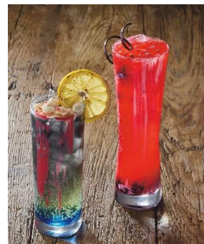
(左) ハウンドウルフ ～クリス・レッドフィールドが率いる精鋭部隊～ (右) リッカー ～セウリスの突然変異～ (¥800～)