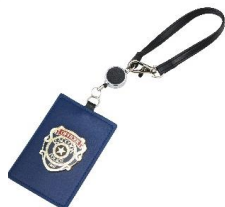
チケットホルダー(¥2,000)