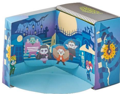
アソートスイーツ(¥1,600)