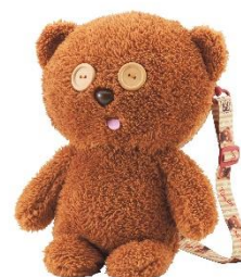
ティム・ポップコーンバケツ (¥3,900)