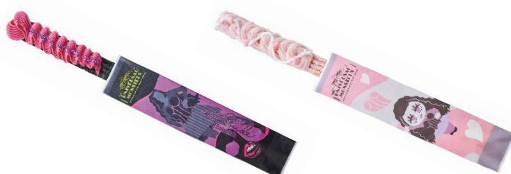
(左) プライド・ドルチェ・チュリツ ～カシスショコラ～ (右) プライド・ドルチェ・チュリツ ～ストロベリーモンブラン～ (¥700)