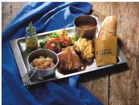
バイオハザード™ プレート ～ラクーンシティ警察署で配給された非常食～ (¥2,980)