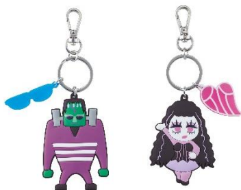
ラバーベアキーチェーン (¥2,200)