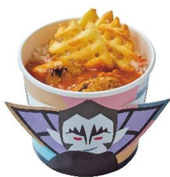
ドラキュラ・バターチキンカレー(¥850)