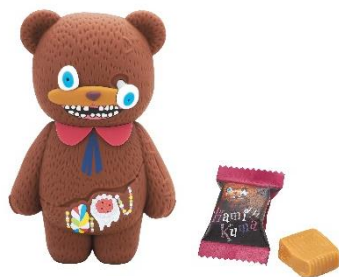
ポーチ付きキャラメル (¥1,900)