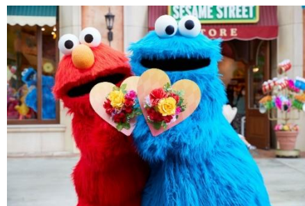
※画像は昨年実施の様子です