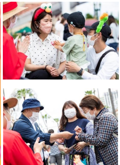
※画像(右上、右下)は昨年実施の様子です

昨年初開催となった「Thanks Love Week」(サンクス・ラブ・ウィーク)では1週間限定での実施にも関わらず、パーク内外で大きな話題を呼びました。 本年は新たに、マーケティング・パートナーの各企業や地元自治体など多方面からの賛同を得て、1ヶ月にわたる感謝月間「サンクス・ラブ・マンス」として拡大実施いたします。 期間限定の「サンクス・ラブ・グリーティング」をはじめ、パークではさまざまなスペシャル・プログラムを予定。また、今年はパークを飛び出して記念イベントの実施や、「サンクス・ラブ・カード」の無料配布など、新たなアプローチをご用意しています。これまでマスクで互いの表情が隠れがちになり、なかなか伝えにくくなっていた“ありがとう”の気持ち。 大切な人とワクワクする瞬間を共有できるパークや仲間たちの後押しがあれば、きっと特別な想いが全力で伝わるはず。今年とはびっきりの笑顔で、心からの感謝を伝えてみませんか？