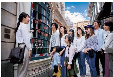
※画像はグループツアーの様様です

https://www.usj.co.jp/web/ja/jp/tickets/guidetour/vip-experience