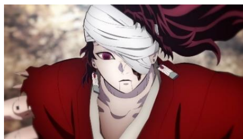
場面カット：アニメ「鬼滅の刃 刀鍛冶の里編」 絡繰人形「縁壱零式」

“ひよっとこ”の面、秘境の里らしい密やかな雰囲気など、細部までこだわり抜いた店内では、「炭治郎」が修行に使った“超リアル”な戦闘用の絡繰人形「縁壱零式」と出会ったり、食事を楽しむ「炭治郎」たちの楽し気な会話を聞くこともできます。鬼との闘いの合間の“ひとときの休息”を満喫してください。