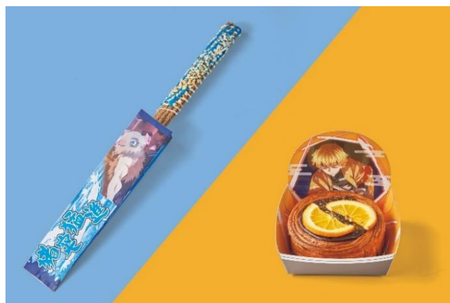
(左) 伊之助の猪突猛進!! チュリトス~チョコ&マロン~ (右) 善逸の霹靂一閃 ロールクロワッサン~チョコクリーム&オレンジ~