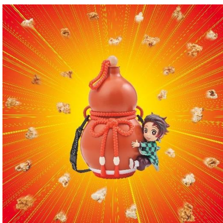
炭治郎のひょうたんポップコーンバケツ ~みたらし味~