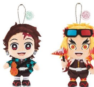
ぬいぐるみキーチェーン (左から) 炭治郎、煉獄