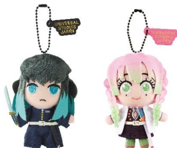
マスコットキーチェーン (左から) 無一郎、蜜璃

オリジナルグッズには、細部までこだわった「マスコットキーチェーン」などの限定アイテムが登場。「無一郎」、「蜜璃」たちと一緒にパークを巡り、「鬼滅の刃」の世界にどっぷり浸ってください。