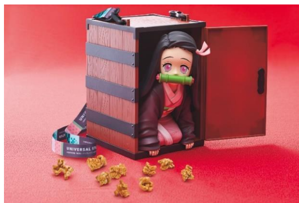
禰豆子のポップコーンバケツ ~みたらし味~

オリジナルグッズには、細部までこだわった「マスコットキーチェーン」などの限定アイテムが登場。「無一郎」、「蜜璃」たちと一緒にパークを巡り、「鬼滅の刃」の世界にどっぷり浸ってください。