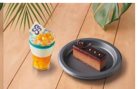
(左) ナミのキラキラみかんパフェ (右) サンジのガトーショコラ ~ラズベリー~