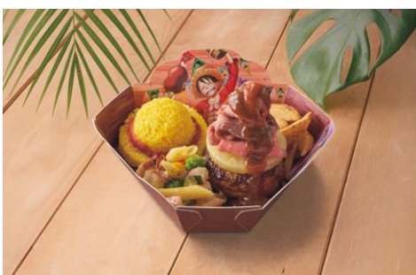
ルフィのもりもり！肉盛りプレート