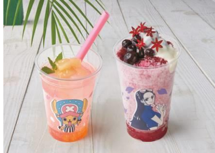
(左) チョッパーのフルーティー・ピーチソーダ (右) ロビンのハナハナ・ブルーベリーフラップ 販売店舗：フォッシル・フェエルズ