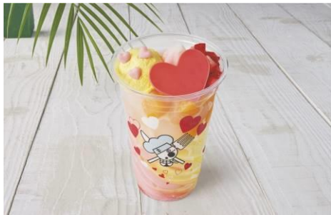
サンジのメロリン♡フローズン・スムージー ～ピーチ&レモン～ 販売店舗：ロンバーズ・ランディング テラス

気軽に楽しめる食べ歩きメニューや冷たいデザート&ドリンクも登場します。サンジからレディへ贈る熱いハートを、あふれんばかりにトッピングした「サンジのメロリン♡フローズン・スムージー ～ピーチ&レモン～」や、抹茶が効いた和フレーバーが絶品の「ゾロの抹茶チュリトス」など、プレミアショーを鑑賞しながら楽しめるフードも登場しています。