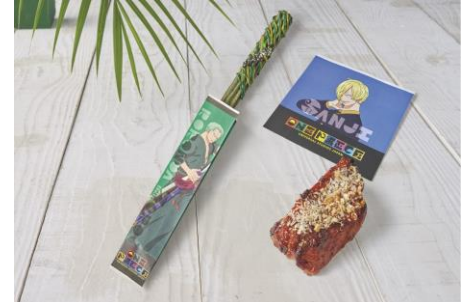
(左) ゾロの抹茶チュリトス (右) サンジのプロヴァンス風 ポークリブ ～トマト&ハーブ～ 販売店舗：ロストワールド・レストラン入口横 フードカート

ショップ『ビバリーヒルズ・ギフト』には、毎年人気の限定デザインの T シャツや、ルフィとお揃いの「麦わら帽子」などコラボグッズが勢ぞろいしました。仲間や家族とおそろいのアイテムで気分をあげて、この夏だけの究極のワンピース体験をお楽しみください。