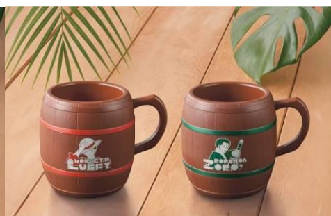
樽マグカップ(ルフィ/ゾロ)