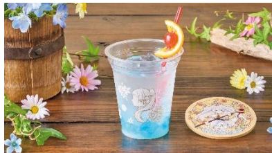
花香る フリーレンのホワイトソーダ (フリーレンコースター付き)

ワイトチョコがポイントです。蝶と鏡蓮華をあしらった大人っぽいデザインのスプーン付きセットもあります。「シュタルクのショコラ&ラズベリーケーキ」は、チョコレートケーキにシュタルクの閃天撃がさく裂した作中の印象的なシーンを再現。中に閉じ込めたラズベリーソースと飛び散るパッションソースで爽やかな味わいに仕上がっています。“新パーティー”と冒険の思い出を振り返りながら、ゆかりのメニューをお楽しみください。