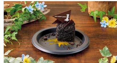
シュタルクのショコラ&ラズベリーケーキ