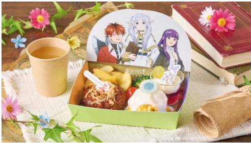
たのしい旅の宝箱 キッズセット ※6歳までのお子さま向けです

“新パーティー”がテーマのハンバーグやオムライスが入った宝箱のようなキッズメニューも登場。ドリンクやスイーツもセットになった充実のラインナップでお届けします。