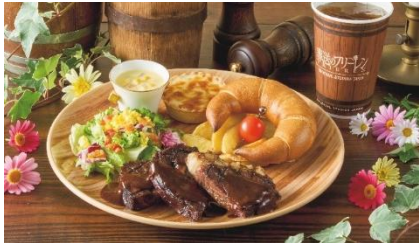
フリーレンのビーフプレート ～赤ワイン香るデミグラスソース～