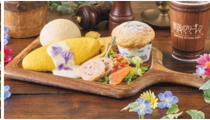
ヒンメルのおムレツプレート