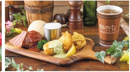
アイゼン&ハイターのハンバーグと フィッシュ&チップスプレート