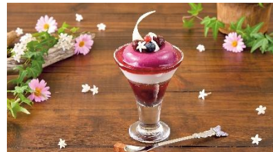
フェルンのチェリー&ブルーベリーパフェ (蝶のスプーン付き)