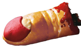
食いちぎられた指