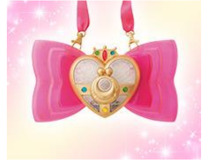
『ユニバーサル・ハート・コンパクト』