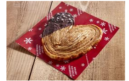
パルミエ・ショコラ ～ミルク～