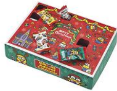
アドベントカレンダー