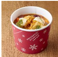
スープリゾット ～ライスロケット& ミネストローネ～