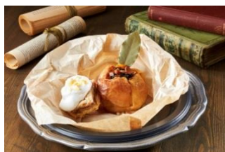
契約のリング ～焼きリングのデザート～