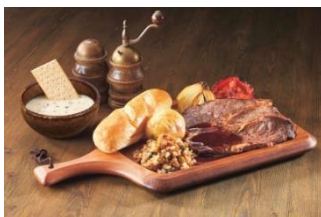
調査兵团プレート ～ビーフステーキ～