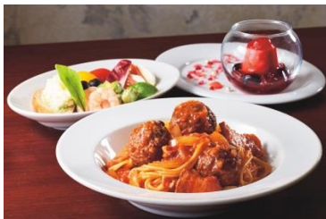
ミートボール・スパゲティ