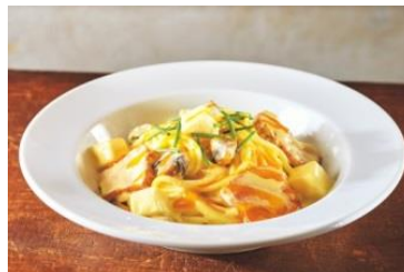
白みそと豆腐のカルボナーラ・スパゲティ(左)と抹茶のパウンドケーキとお米のデザート(右) (ともに五右衛門がいつも注文するメニューをイメージ)