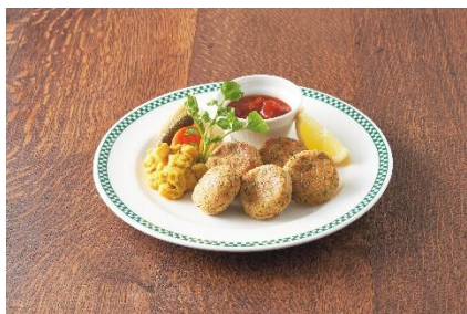
<NEW!!> 「ひよこ豆のコロッケ トマトサルサ 添え」 (フィネガンズ・バー&グリル)