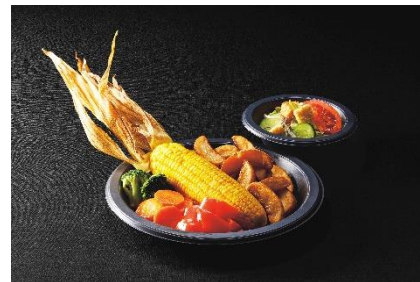
「ベジタブルプレート」* (三本の箒™)

※これまでは特別メニューとして対応してきましたが、今後はランドメニューとしてすべてのゲストの皆様にご提供します