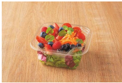
<NEW!!> 「ミックスベリーのサラダ」 (ビバリーヒルズ・ブランジェリー)