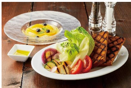
「グリルサラダ&フルーツカクテル」* (パークサイド・グリル)