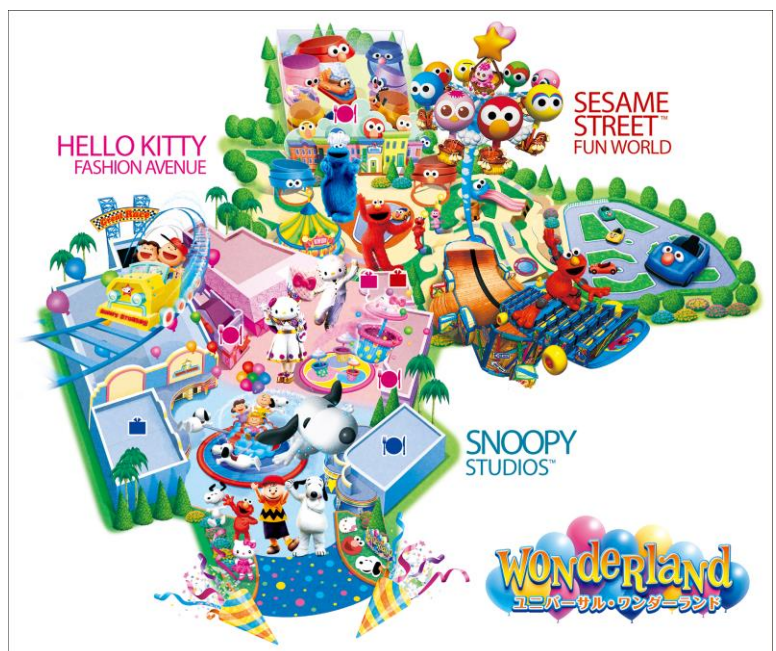
約3万㎡の広大な敷地に広がる 新「ユニバーサル・ワンダーランド」の地図

「 エルモのゴーゴー・スケートボード 」は、エルモが大好きなスケートボードをモチーフにしたライド・アトラクションです。エルモと一緒に巨大なスケートボードに乗り、家族みんなで爽快地斜面を駆け抜ければ、予測できない動きとスピ