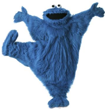
クッキング教室の先生になる クッキーモンスター

クッキーモンスターとクッキングを楽しめる、非常にユニークなプログラム「 クッキーモンスターのくいしんぼうクッキング 」が新登場します。