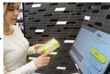
③ 出口のディスプレイで購入商品を確認して決済