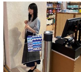
④ 出口ゲートから退店する。