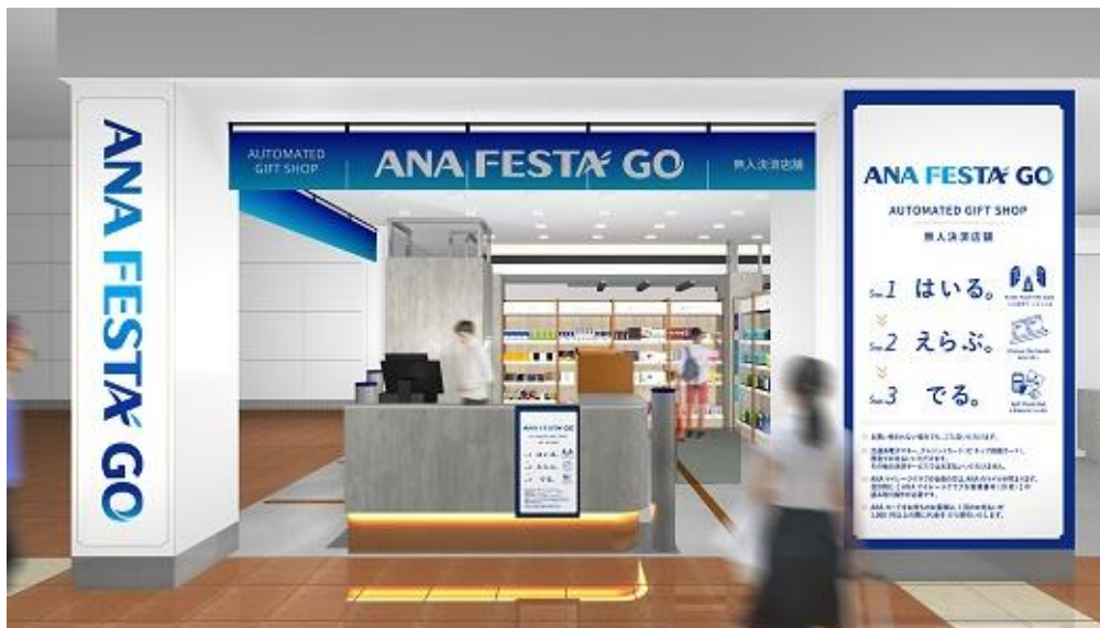
● 店舗 正面イメージ

※無人決済システムを活用した実用化店舗…ウォークスルー型の店舗で、カメラなどの情報から入店したお客様と手に取った商品をリアルタイムに認識して、決済エリアにお客様が立つとタッチパネルに商品と購入金額が表示され、表示内容を確認して支払うだけでお買い物ができる店舗を指します。