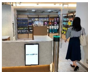
① 入口ゲートから入店する。

商品を手に取り、出口でタッチパネルの表示内容を確認し、お支払いするだけでお買い物が完了します。