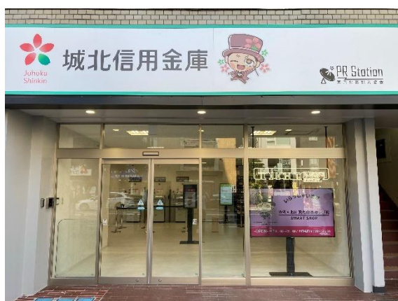
城北信用金庫 王子営業部 王子北本通り出張所