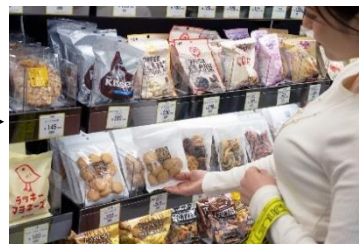
② 商品は手持ちのバックに入れても OK