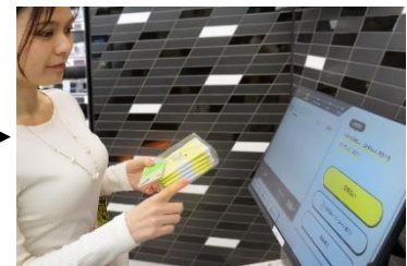
③ 出口のディスプレイで購入商品を確認して決済