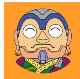
磐梯デジとくアプリアイコン

初めてデジタル化に踏み切ったため、一部、紙の商品券も発売いたします。多くの方にデジタルでの利用を体験して欲しいという思いから、紙の商品券は20%のプレミアム率のところ、磐梯デジとくは25%と、よりお得に購入できます。例えば、5,000円を支払うと、紙の場合は6,000円分の商品券をお渡ししますが、磐梯デジとくの場合は、6,250円分の電子商品券が専用のアプリにチャージされます。チャージした商品券は、既存のQRコード決済アプリと同じような操作方法で、1円単位での利用が可能です。