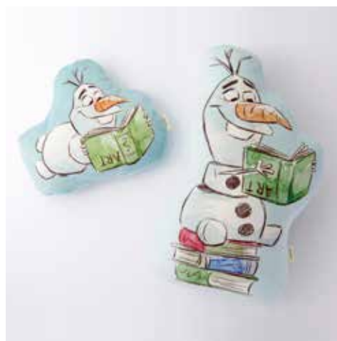
ホットウォーターボトル ¥3,000、ダイカットクッション ¥3,200、