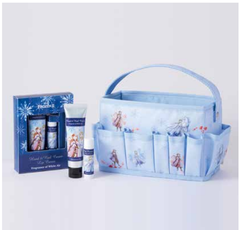
ハンド&リップクリームセット ¥1,500、ハンドクリームS ¥800、リップクリーム ¥700、 コスメバスケットS ¥2,500