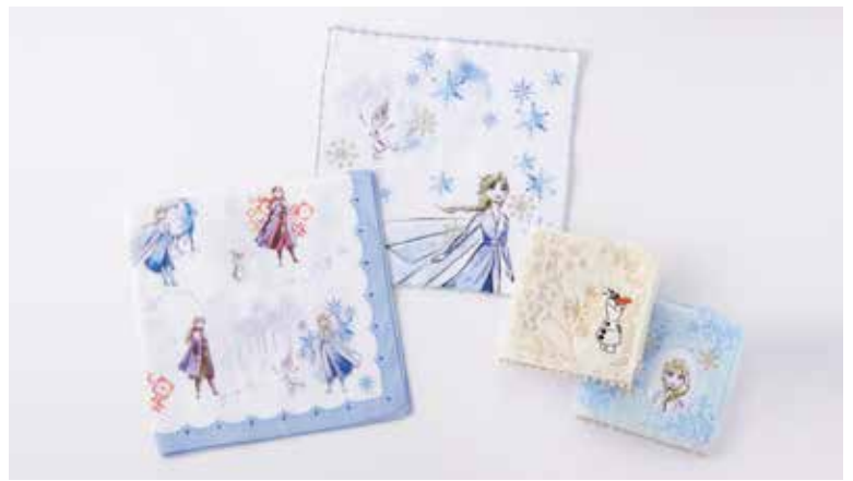
ハンカチ ¥1,600、ミニタオル 各¥700