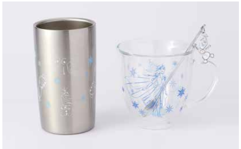
ステンレスタンブラー ¥2,500、耐熱Wウォールマグ ¥1,800、チャームスプーン ¥600