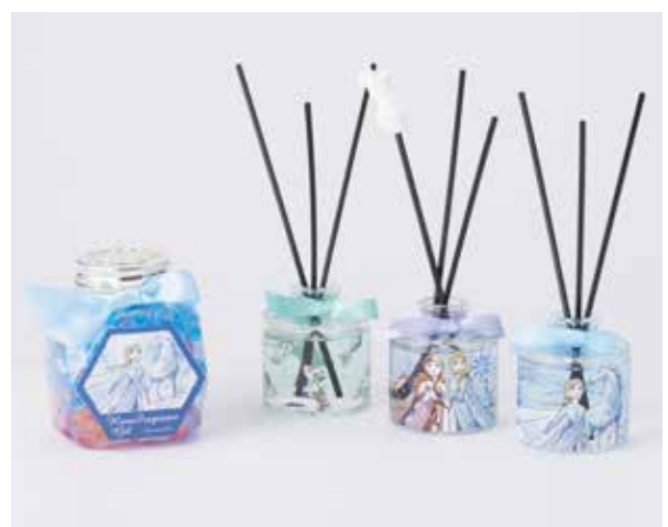
フレグランスピースジェル ¥700、ディフューザーセット ¥2,300