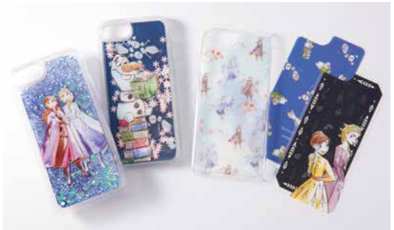
オイルインフォンカバー(iPhone8/7/6/6s対応) 各¥2,500、フォンカバー(iPhone 8/7/6/6s対応) ¥2,500