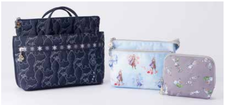
バッグインバッグ ¥3,200、ダブルジップポーチ ¥2,800、ティッシュケースポーチ ¥1,600