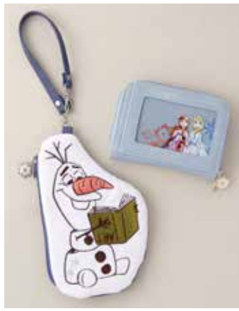
パスケース ¥2,400、キーコインケース ¥2,400