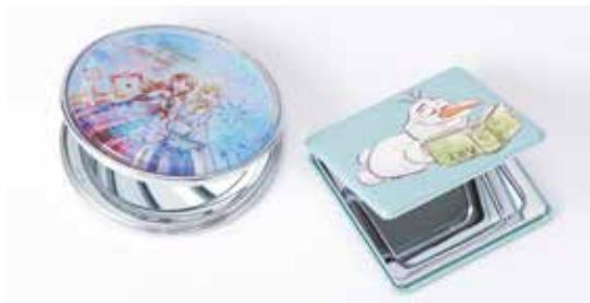
オイルインミニミラー ¥900、ミニミラースクエア ¥600