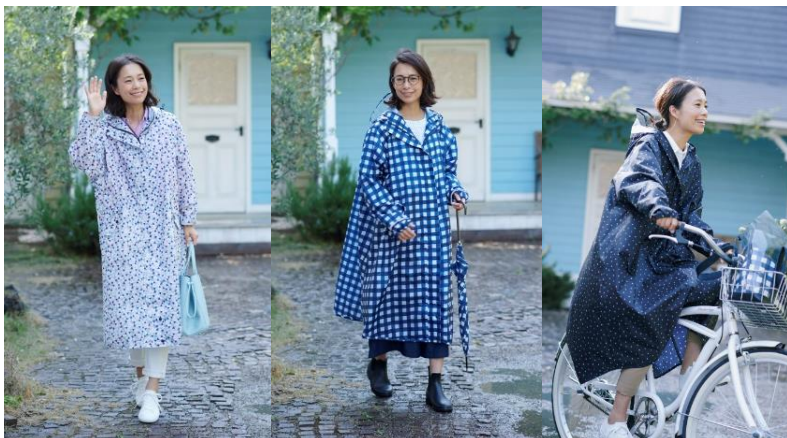
レインドルマンコート(ポーチ付き)¥6,372 4色展開 (ドット、チェック、スィム、ジオメトリック)

株式会社サザビーリーグ (本社：東京都渋谷区千駄ヶ谷／代表取締役社長 角田 良太) が運営する Afternoon Tea LIVING は、2018年5月31日(木)より、「HAPPY RAINY DAYS!」をテーマに梅雨を快適に過ごすためのレインアイテムやママに向けたレインコートを発売します。「ママたちの雨の日の悩みを解消できるレインアイテムを作りたい」という思いからアフタヌーンティー・リビングのママスタッフが商品開発に携わり、働くママならではの視点で使いやすいさや機能性をとことん追求。昨年よりさらに着やすく、機能性をアップデートしました。