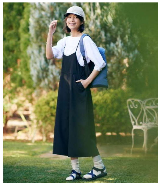
「バンセル®クール」プルオーバー ¥5,292、サロペット ¥6,372、リュック ¥5,292、キャップ ¥3,132

春の日差し対策にうれしい UV カット効果付き！ 便利に使えるシャツワンピースを「バンセル®クール」 素材にすれば、見た目も爽やかで開放的な気分になれます。ボタンの開閉で自由な着こなしを楽しめるから、温度調整も楽々。形態安定効果で、洗濯後もシワがつきづらく、お手入れが簡単。