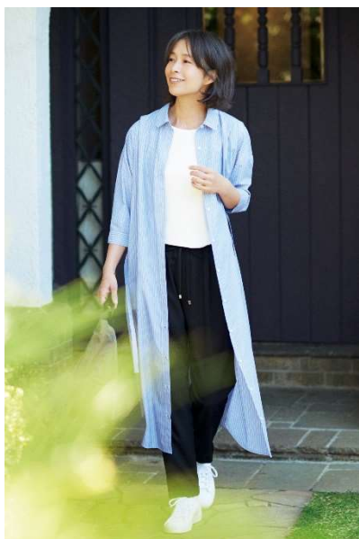
「バンセル®クール」ワンピース ¥7,452、タックパンツ ¥5,292

春の日差し対策にうれしい UV カット効果付き！ 便利に使えるシャツワンピースを「バンセル®クール」 素材にすれば、見た目も爽やかで開放的な気分になれます。ボタンの開閉で自由な着こなしを楽しめるから、温度調整も楽々。形態安定効果で、洗濯後もシワがつきづらく、お手入れが簡単。