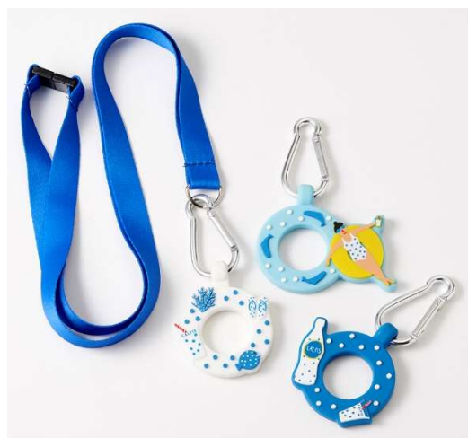
ドリンクホルダー 各 ¥1,296