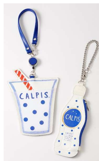
ダイカットバスケース ¥2,484