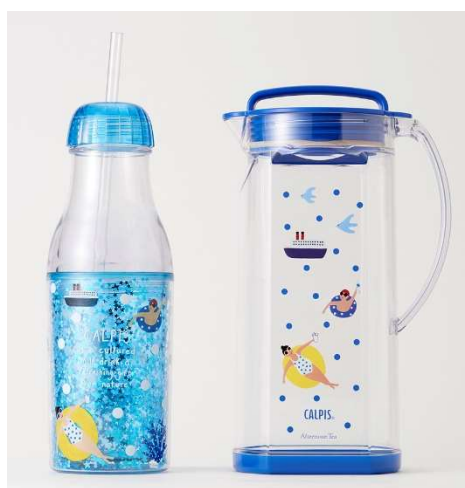
ストロー付タンブラー ¥1,620