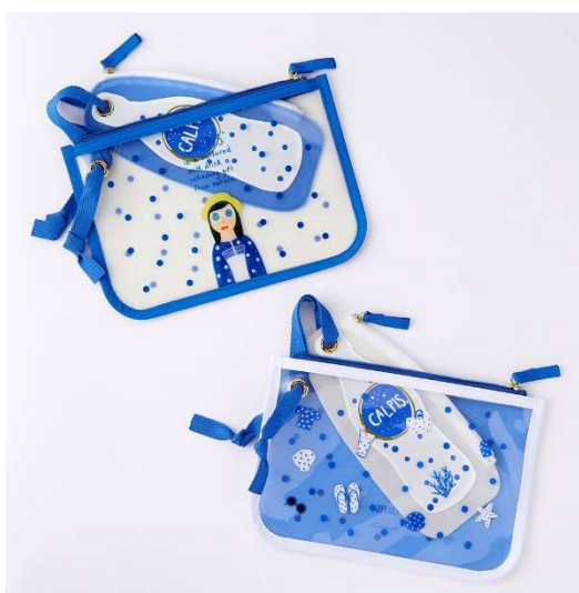
入れ子ポーチ 各 ¥2,700