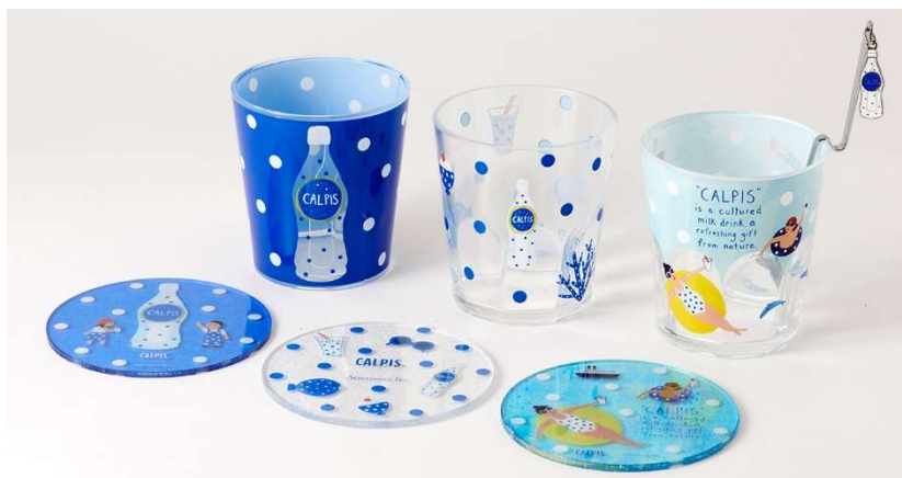
樹脂タンブラー 各 ¥594、コースター 各 ¥756、マドラースプーン ¥756