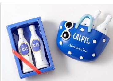
マグネット 各 ¥540、