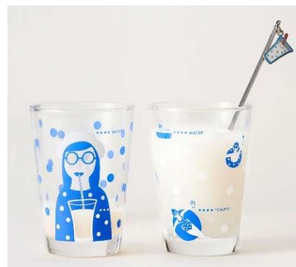
グラスタンブラー-295ml 各 ¥702、マドラー ¥756

シカゴを拠点に活躍しているイラストレーター／サーフェイスデザイナー。日々の暮らしや旅で得たインスピレーションを書き留めた絵日記をもとに制作活動を行う。水彩絵の具や鉛筆を使ったイラストが得意。