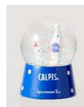
ドーム型マグネット ¥702