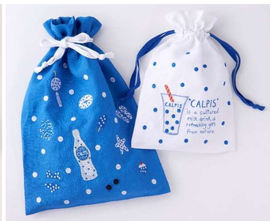
巾着 L ¥1,728、M ¥1,296