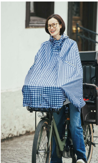
レインサイクルポンチョ（ポーチ付） ¥7,000