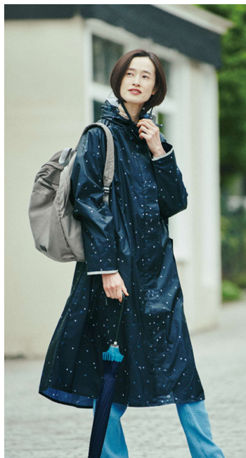
レインドルマンコート（ポーチ付） ¥6,500