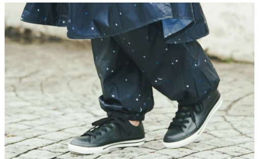
レインレッグカバー (ポーチ付き) ¥2,000 ※店舗限定