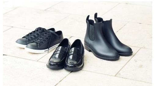
レインローカットスニーカー ¥3,900、レインローファー ¥3,900 レインブーツ ¥3,900