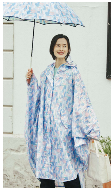
レインポンチョ（ポーチ付） ¥6,500 ※店舗限定